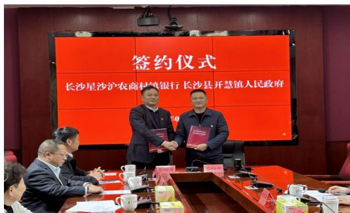
“普惠金融助力乡村振兴战略合作协议”签约仪式

优质服务： 优化网点布局、拓展服务渠道、提升服务质量（投诉、信息保护、满意度调查）、优化业务流程等。