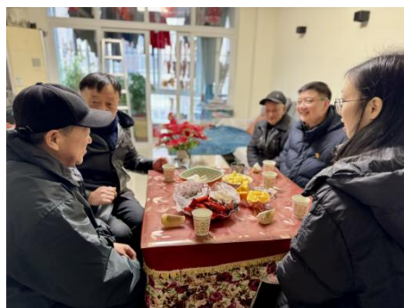
星沙村行开展慰问困难党员活动