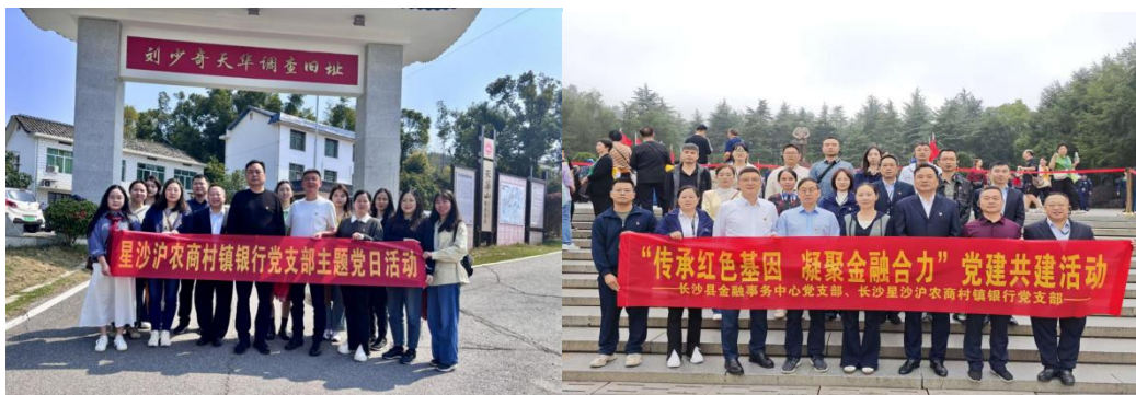
星沙村行党支部开展党建共建活动

为深入学习贯彻党的二十大精神，传承红色革命精神，深化党建引领金融发展的融合实践，10月16日，长沙县金融事务中心党支部与长沙星沙沪农商村镇银行党支部赴伟人故里一韶山，联合开展“传承红色基因 凝聚金融合力”党建共建主题党日活动。双方党员代表共同追寻伟人足迹，重温革命历史，汲取奋进力量。此次党建共建活动，不仅加强了长沙县金融事务中心与长沙星沙沪农商村镇银行之间的沟通联动，更有效推动了党建工作与金融业务的深度融合。双方将以此次活动为契机，进一步弘扬红色精神，强化责任担当，把红色基因融入金融服务全过程，凝聚起服务实体经济、助力乡村振兴的奋进力量。